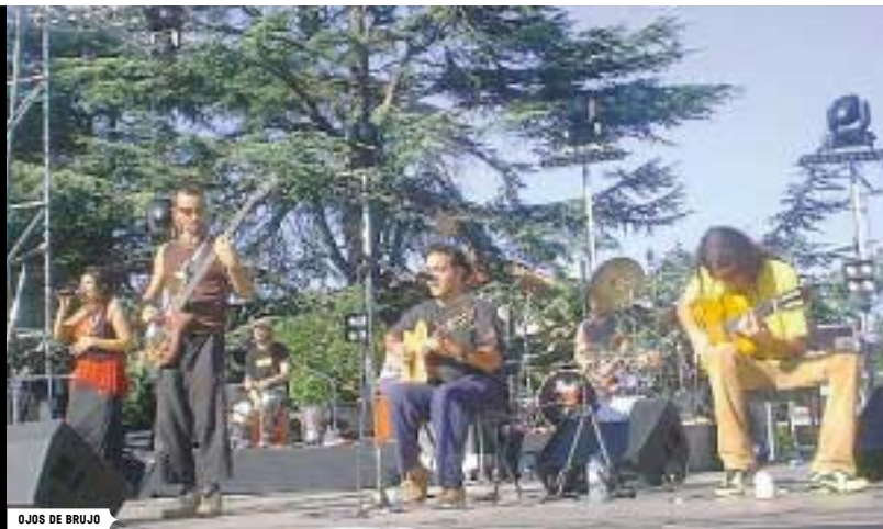
OJOS DE BRUJO